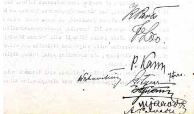
Fragment riigikohtu otsusest Susi-Tannebaumi asjas

otsustas Riigikohtu üldkogu: Kohtupalati vanema esimehe kaevatud korraldus tühistada ja temale ette kirjutada ajaks uus seadusele vastav korraldus teha.-